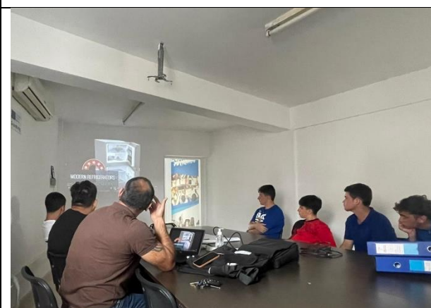
Discuții la office, flux 1, Cipru